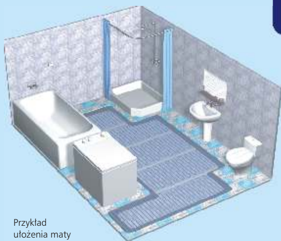
Przykład ułożenia maty grzejnej

Maty grzejne jednostronnie zasilane dzięki swojej budowie są jeszcze prostsze w układaniu i montażu. Maty dwustronnie zasilane są cieńsze, natomiast podczas układania należy pamiętać aby oba przewody zimne zostały doprowadzone do jednego punktu zasilającego.